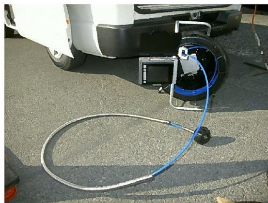
自社のTVカメラ調査車両