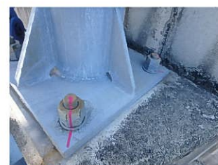
合いマークの施工