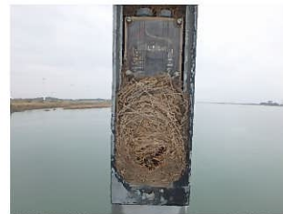
橋桁添架照明内部(鳥巢)