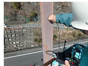
詳細調査(板厚測定)