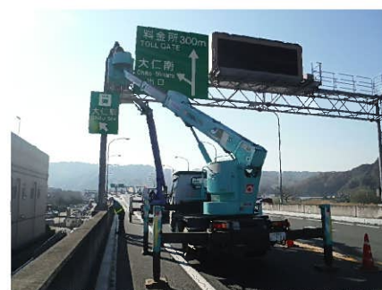
複数車両による規制時間の短縮