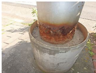
照明施設基部の腐食