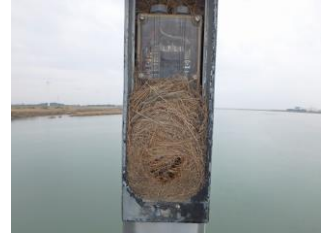
橋桁添架照明内部(鳥巢)