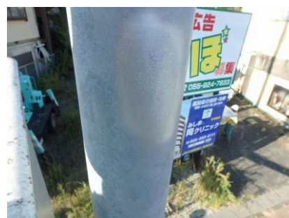
損傷が軽微な段階での応急措置の例