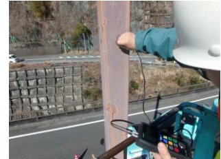
詳細調査(板厚測定)