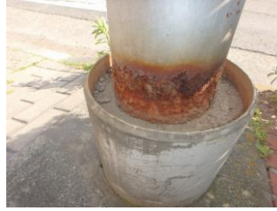
照明施設基部の腐食