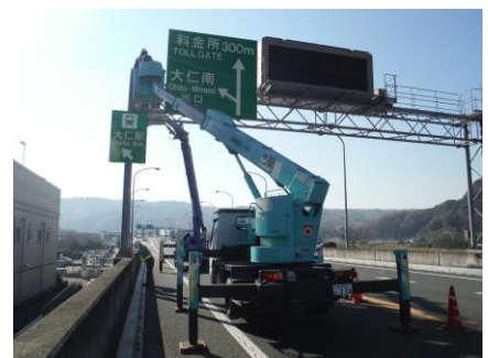
複数車両による規制時間の短縮