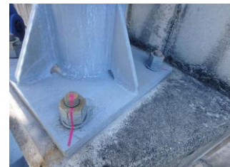
合いマークの施工